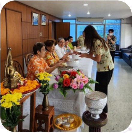
เมื่อวันพุธที่ 10 เม.ย. 67 สหกรณ์ฯ จัดพิธีรดน้ำดำหัว เพื่อขอพรคณะกรรมการอาวุโส เนื่องในวันสงกรานต์ ประจำปี 2567