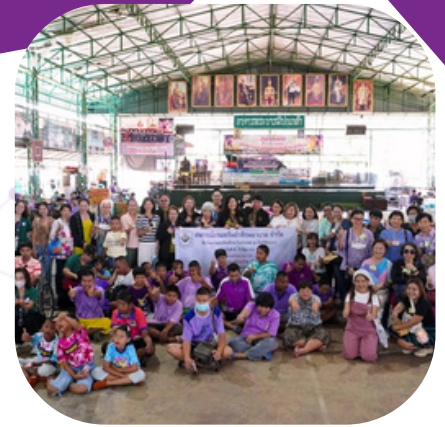
เมื่อวันที่ 8-9 มิ.ย. 67 สหกรณ์ฯ จัดสัมมนาและทัศนศึกษาในประเทศ ณ จังหวัดระยอง และทำกิจกรรม CSR มอบสิ่งของ เครื่องอุปโภค บริโภค ต่างๆ ให้กับมูลนิธิบ้านครอบครัวบุญชูเพื่อเด็กพิเศษ จังหวัดชลบุรี