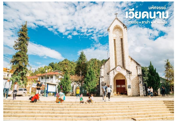
มทศจรรย เวียดนาม ฮานอย • ซาปา • ฟานซีปัน

กลางวัน | บริการอาหารกลางวัน ณ ร้านอาหาร หน้าท่า ชมโบสถ์หินซาปา ที่สร้างขึ้นโดยชาวฝรั่งเศส แต่เดิม มีชาวฝรั่งเศสจำนวนมากอาศัยอยู่ในเมืองนี้ ทำให้มี การสร้างโบสถ์นี้ขึ้นเพื่อให้ชาวฝรั่งเศสเข้าร่วมพิธี มิสซาในวัดหยุด แต่ในปัจจุบันได้มีการอนุรักษ์โบสถ์ แห่งนี้ไว้เป็นที่รำลึกและยังเป็นสถานที่ท่องเที่ยวอีก แห่งหนึ่งที่มีความสวยงามเป็นอย่างมากในเมืองซา ปา จากนั้น หน้าท่าชม ทะเลสาบซาปา ซึ่งเป็นทะเลสาบที่ตั้งอยู่ บริเวณกลางเมืองซาปา กว้างใหญ่และน้ำนิ่งสงบ ยามค่ำคืนมีการประดับไฟแสงสีสวยงาม ซึ่งรายล้อม ไปด้วยบ้านเรือนสถาปัตยกรรมที่ได้รับอิทธิพลมาจากยุโรป สีสันของบ้านที่เรียงราย สะท้อนกับน้ำในทะเลสาบ ฉาก หลังเป็นทิวเขาสลับกันไป ทำให้เกิดภาพวิวที่สวยงามสมกับสวิตเซอร์แลนด์เวียดนามที่รำลือจริง ๆ