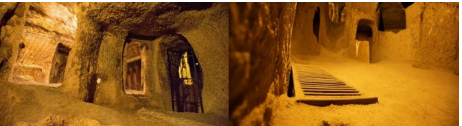
ระมัดระวังในการลงไปชมเมืองใต้ดินนี้

นำท่านเข้าชม เมืองใต้ดิน (Underground City) เป็นสถานที่ที่ผู้นับถือศาสนาคริสต์ใช้หลบภัยชาวโรมัน ที่ต้องการ ทำลายร่างพวกนับถือศาสนาคริสต์ ภายในมีโซนห้องต่างๆ อาทิ ห้องนอน ห้องน้ำ ห้องครัว ห้องหมักไวน์ ห้องประชุม คอกสัตว์ โบสถ์ บ่อน้ำ บางห้องเป็นห้องโถงกว้างว่ากันว่าสามารถจุคนได้มากกว่า 30,000 คน และระบบระบายอากาศ ที่ดี แต่อากาศค่อนข้างบางเบาเพราะอยู่ลึกและทางเดินบางช่วงอาจค่อนข้างแคบจนเดินสวนกันไม่ได้ ควรใช้ความ