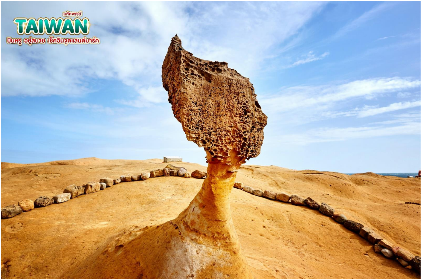
บ่คัจจรรยี่ TAIWAN บินทรู อยู่สบาย เช็คอินจุดแลนด์มาร์ค

จากนั้น นำท่านเดินทางสู่ ถนนโบราณจีวเฟิ่น (Jiufen Old Street) หมู่บ้านโบราณบนไหล่เขาซึ่งในอดีตเคยเป็นแหล่งขุดทองชื่อดังของไต้หวัน เมื่อกาลเวลาผ่านไปเหลือเพียงบ้านเรือนแบบเก่าเป็นสิ่งดึงดูดใจให้นักท่องเที่ยวมาเยือน ชมร้านรวงต่างๆ ทั้งร้านน้ำชา ร้านขายขนม และ ของที่ระลึก ชมวิวทิวทัศน์ของบ้านโบราณซึ่งประดับด้วยโคมไฟสีต่างๆ และตรอกซอยเล็กๆ ที่เต็มไปด้วยร้านค้าและนักท่องเที่ยวจำนวนมาก จากนั้น นำท่านเดินทางสู่ เมืองไทเป