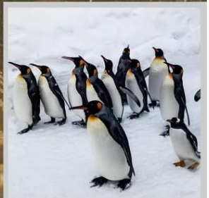
"PENGUIN ASAHIYAMA ZOO"