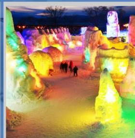
"SHIKOTSU ICE FEST"