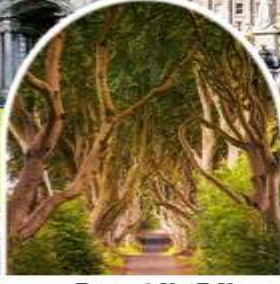
อุโมงค์ต้นไม้