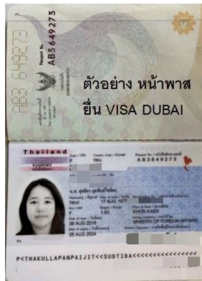
ตัวอย่าง หน้าพาส ยื่น VISA DUBAI