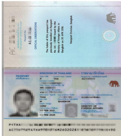
สแกนหน้าพาส ต้องสแกนให้ตรง ต้องเป็นสีเท่านั้น!!