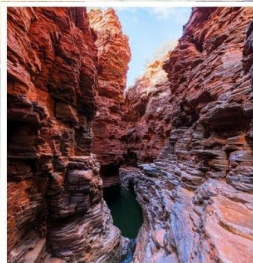
แกรนด์แคนยอนยูอาโกว