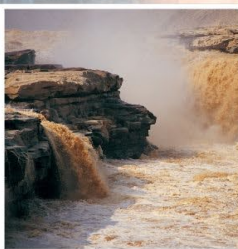
น้ำตกหูโข่ว