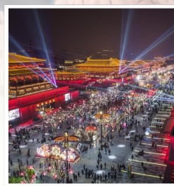
ถนนคนเดิน วัฒนธรรมต้าถิง