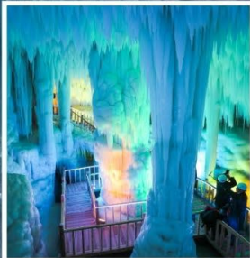
ถ้ำน้ำแข็งอวิ้นชีวซาน