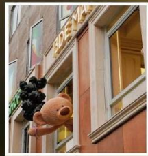
ถนนอันฟู่