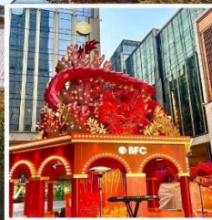
THE BUND WEEKEND MARKET BFC