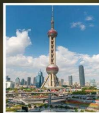
ชั้นหอไข่มุก