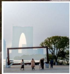
SUZHOU LARGE PHOTO FRAME