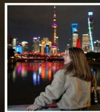
เซี่ยงไฮ้ คลาสสิก ไนท์