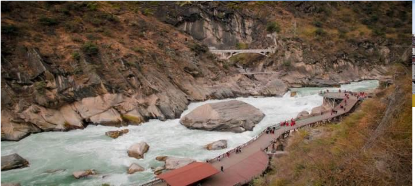
(แม่น้ำทรายทอง) เป็นช่องแคบที่มีน้ำไหลเชี่ยวมาก ช่วงที่แคบที่สุดประมาณ 30 เมตร

นำท่านเดินทางสู่ วัดลามะซังจ้านหลิง สร้างขึ้นในปี ค.ศ. 1679 เป็นวัดลามะที่มีอายุเก่าแก่กว่า 300 ปี มีพระลามะจำพรรษาอยู่กว่า 700 รูป สร้างขึ้นโดยตะไลลามะองค์ที่ 5 มีโบราณวัตถุมากมาย รวมทั้งรูปปั้นทองสัมฤทธิ์ที่มีชื่อเสียงมากที่สุดจากนั้น นำท่านชม ช่องแคบเสือกระโดด (รวมบันไดเลื่อนขึ้น-ลง) ซึ่งเป็นช่องแคบช่วงแม่น้ำแยงซีไหลลงมาจากจินซาเจียง