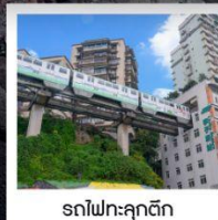
รถไฟฟ้าลุดัก

ทัวร์คุณธรรม ไม่ลงร้านช้อปปิ้ง • ไม่ขายออฟชั่น