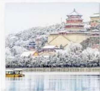
พระราชวังฤดูร้อน อวิเหอหยวน