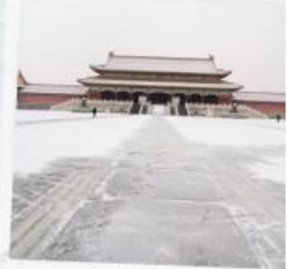
พระราชวังกุ่กง