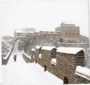
กำแพงเมืองจีน ด่านจวิหยงกวน