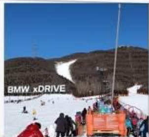
เล่นสกีจวินตุชาน