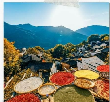
หมู่บ้านหวงลิ่ง