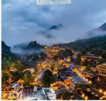
หุบเขาวังเซียนกู่