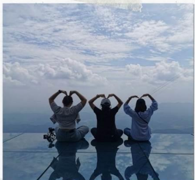
กระจกแห่งท้องฟ้า