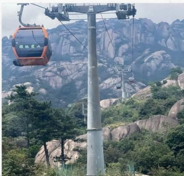
เขาลิงซาน