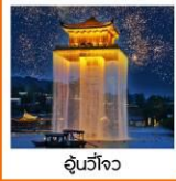
อุโมงค์โจว

พักโรงแรม 4 - 5 ดาว อาหารพิเศษ ภัตตาคารหรู เดินทางรถส่วนตัว / สุกี่หม่าล่า มินิทัวร์ส่วนตัว / ไม้สอยออพชั่น