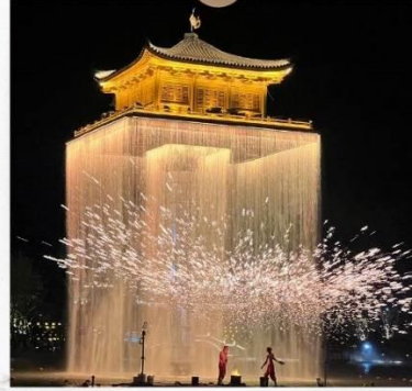
แสงไฟอุโมงค์โจว