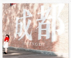
CHENGDU EASTERN MEMORY