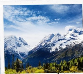
ภูเขาหิมะการ์เซีย ต้ากู่ปิงชวน