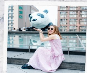
IFS แพนด้าปีนตึก