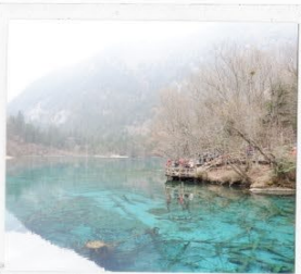
อุทยานจี่จ้ายโกว