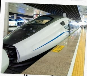
รถไฟความเร็วสูง สู่จี่จ้ายโกว