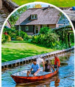
ล่องเรือชมหมู่บ้านกังหัน

หมู่บ้านกังหัน | เมืองบรูจส์ เมืองมรดกโลก | บริสเซล | ลักเซมเบิร์ก ประติมากรรมอะโตเมียม | เทียวกองปารีส เข้าชม พระราชวังแวร์ซายส์