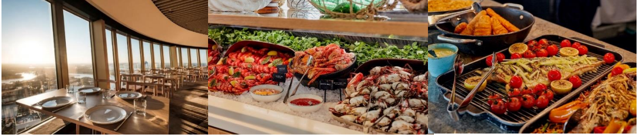
* กรุณาแจ้งชื่อโรงแรมล่วงหน้า *

เที่ยง นำท่านขึ้นหอคอยซิดนีย์ พร้อมรับประทานอาหาร บุกเฟ้นานาชาติ SKYFEAST AT SYDNEY TOWER RESTAURANT พร้อมชมวิวมุมสูงของนครซิดนีย์