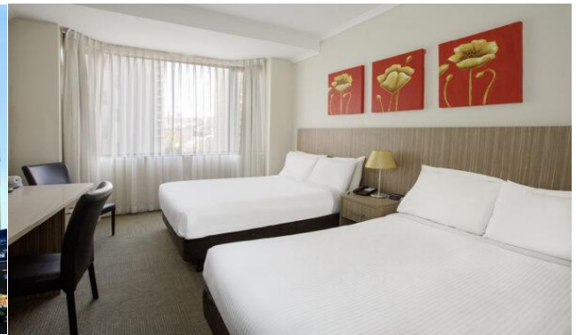
(โรงแรมย่านกลางเมือง ใกล้แหล่งช้อปปิ้ง เดินทางสะดวก) *รูปภาพเพื่อการโฆษณา*

วันที่ทำ ซิดนีย์ - อุทยานแห่งชาติบลูแมท์เทิร์นส์ - เขาสามอนงค์ - ขับบั้งย่านใจกลางเมืองและห้าง Q.V.B.