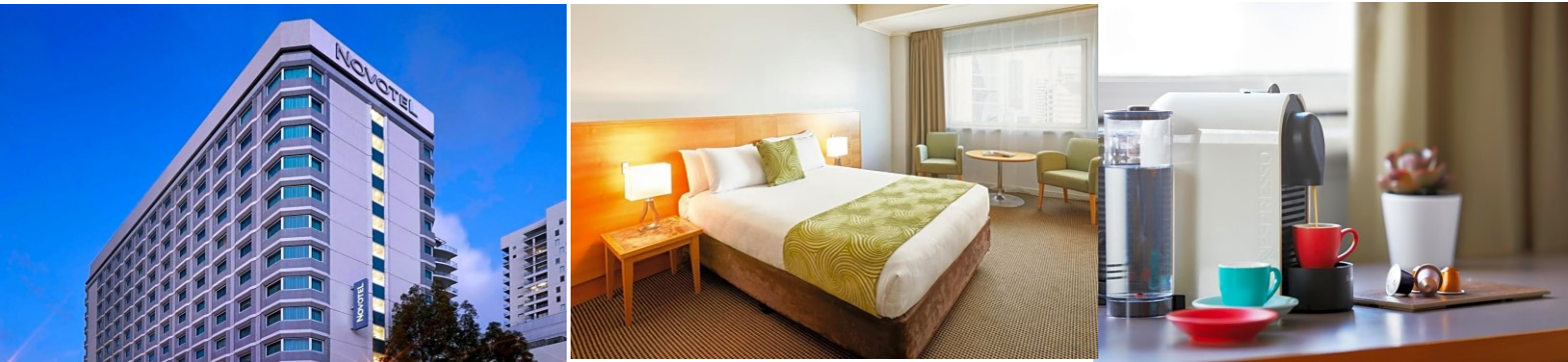
(โรงแรมย่านกลางเมือง ใกล้แหล่งช้อปปิ้ง เดินทางสะดวก) *รูปภาพเพื่อการโฆษณา*

นำท่านเดินทางเข้าสู่ที่พัก NOVOTEL LANGLEY PERTH HOTEL หรือเทียบเท่า (4 ดาว****)