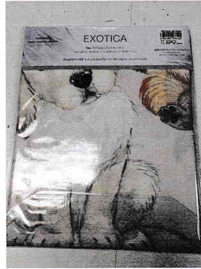
รูปที่ 2 : G 2244-1/65 ด้านหลัง