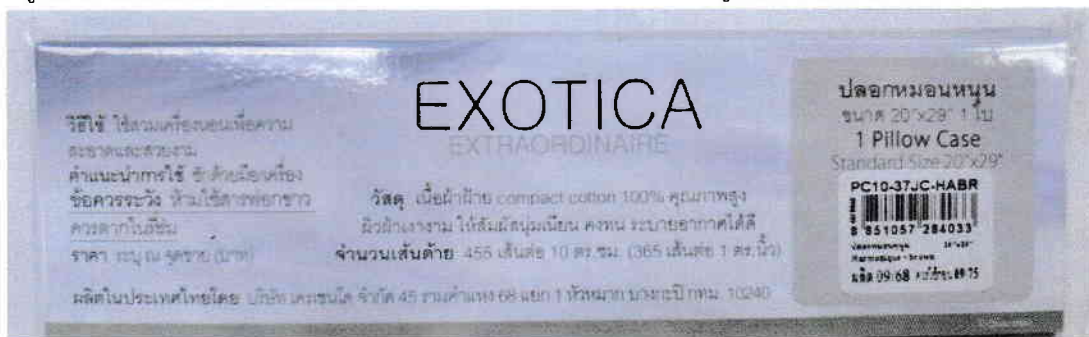
รูปที่ 3 : G68-5007-01 ฉลากที่ระบุจำนวนเส้นด้าย