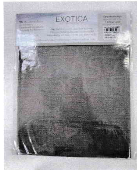
รูปที่ 2 : G68-5007-01 ด้านหลัง