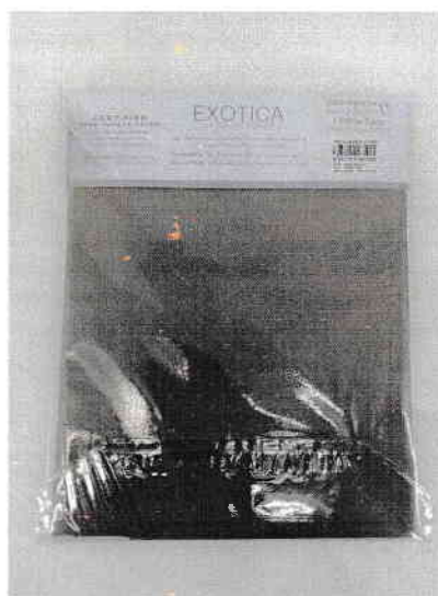
รูปที่ 2 : G 0088-1/67 ด้านหลัง