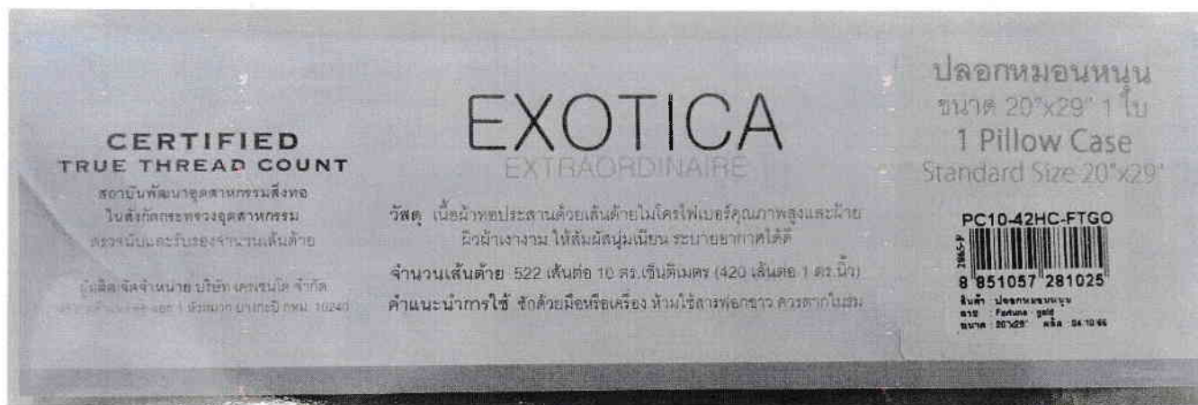
รูปที่ 3 : G 0088-1/67 ผลากที่ระบุจำนวนเส้นด้าย