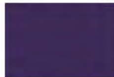
Rare Orchid 7197