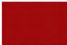
Scaret Medium #F1103