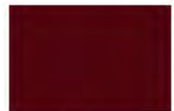
Cinquasia Red F1104