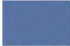
Harbor Blue 7270