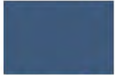
Blue Monday 7294