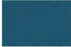
Sea Of Midnight 7437