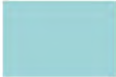
Fantasy Flight 7442