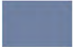
Cape Horn 7263