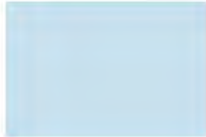
Sail Away 7298