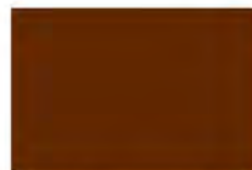
Coral Red F6102