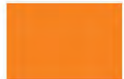
Fresh Orange F7103