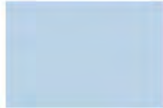
Sweet Harbor 7289