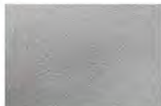
Silver Bronze F5100