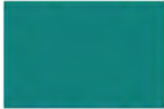
Aqua Marine 7454