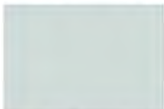
Delight Grey F5002