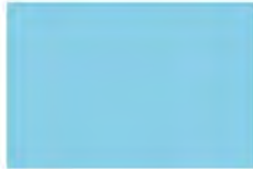
Bonnie Blue F4103