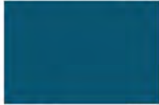
River Blue F4104