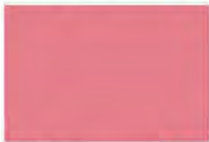
Lady Love 8086