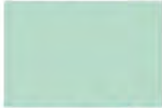
Aqua Infusion 7506