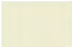
Pearl White F5104