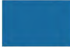
Cyan Blue F4106