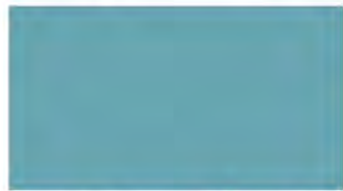
Crystal Blue ▲ M 717