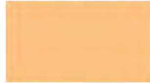
Apricot Cream M 207