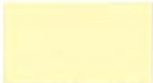
Creamy White M 204