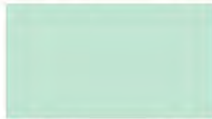
Sky Blue M 156