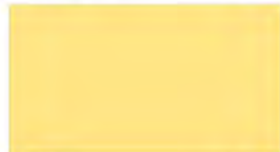
Cream M 113