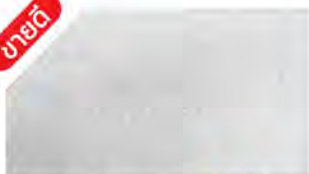
Bright Silver ▲ M 000