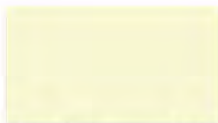
Silver Mist M 193