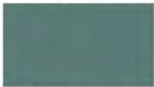
Dove Grey M 687