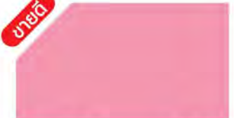
Dawn Pink M 311