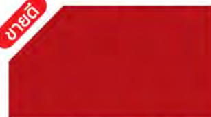
Ferrari Red ▲ M 335