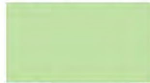
Surf Green M 116