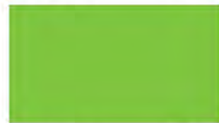
Tropicana M 654