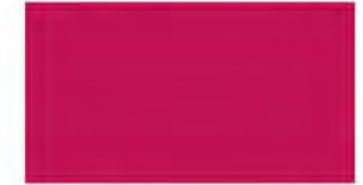
Berry Pink M 312