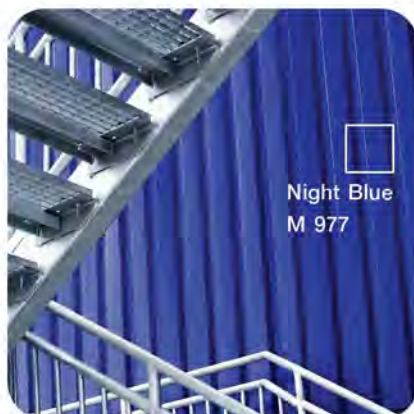
Night Blue M 977