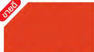
Scarlet Orange ▲ M 334