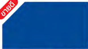
Navy Blue ▲ M 877