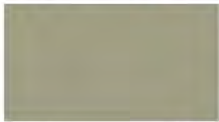
Pewter M 695