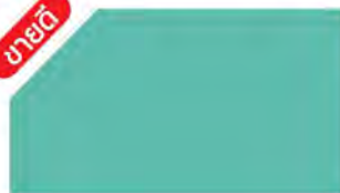
Ocean Blue M 177