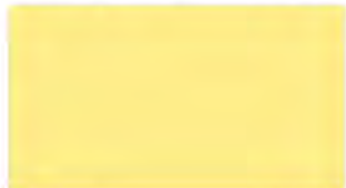
Jonquil M 433