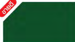
Grass Green ▲ M 666