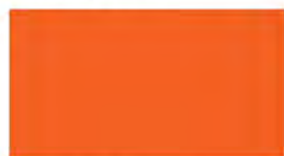
Red Lead Primer