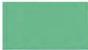
Zircon Blue M 711