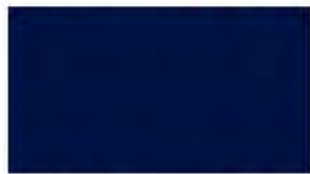
Night Blue M 977