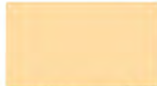
Fresh Apricot M 206