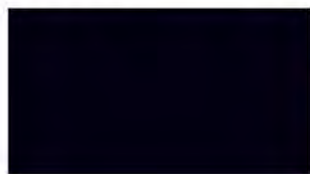
Midnight Blue M 889