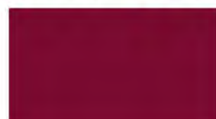
Cheery Red M 332