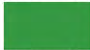
Spring Green M 655