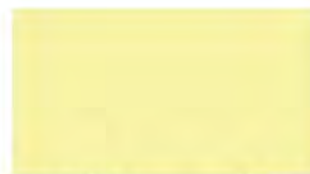
Ivory White M 115