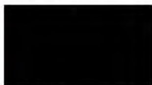
Matt Black M 888