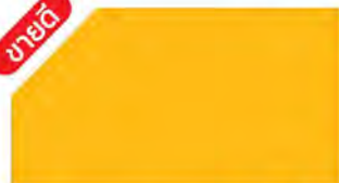
Yellow Orange ▲ M 444