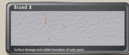
Surface damage and visible formation of rusty spots.