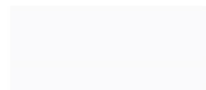
P-2000 Universal Undercoat สีรองพื้นไม้กันเชื้อรา