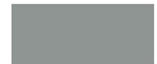
P-2600 Gray Primer สีรองพื้นกันสนิมเทา