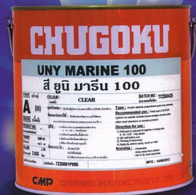
ผลิตภัณฑ์สี UNY MARINE 100 หนึ่งในกลุ่มสี UNY MARINE SERIES

สีทับหน้าประเภท อะคริลิก อะลิฟาติก โพลียูรีเทน ชนิดเนื้อสีสูง ให้ความเงาสูงมากพิเศษ และคงความเงาได้นานกว่าสีโพลียูรีเทนทั่วไป ฟิล์มสีทนต่อสารเคมีและช่วยปกป้องโครงสร้างเหล็กจากแสง U.V. เหมาะกับการใช้งานภายนอกเปลือกเรือ, สะพาน, โรงงานผลิตสารเคมี, ถังบรรจุน้ำมันและของเหลว และงานที่อยู่ท่ามกลางสภาวะแวดล้อมและแสงแดดรุนแรง