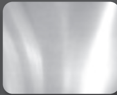
อะลูมิเนียม