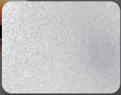
กัลวาไนซ์