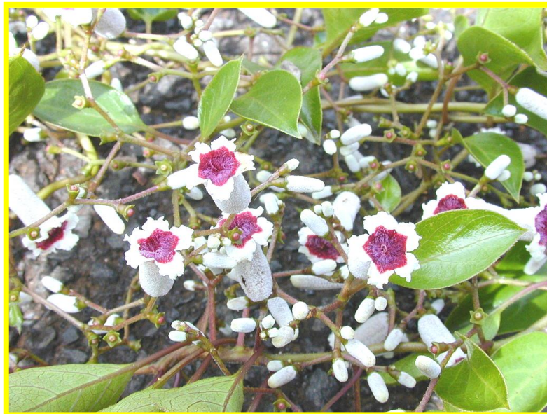
รูปต้นเถากระพังโหม

ตำบลทุ่งกระพังโหม แต่เดิมเป็นทุ่งที่มีเถาว์วัลย์ชนิดหนึ่งขึ้นอยู่มาก โดยชาวบ้านแถบนี้ เรียกว่า "เถาตุตหมตุตหมา" สภาพโดยรวมเป็นทุ่งที่อุดมสมบูรณ์ไปด้วยพืชไม้นานาชนิด และสภาพบางส่วนเป็นหนองน้ำที่มีสัตว์ชุกชุมมาก โดยเฉพาะอย่างยิ่งปลาไหล ราษฎรที่อพยพมาในกลุ่มแรกมาจาก อำเภอโพธาราม จังหวัดราชบุรี (ในปัจจุบัน) ต่อมาได้เรียกชื่อใหม่เป็น "ทุ่งกระพังโหม" ตามคำสุภาพ และเรียกมาจนถึงปัจจุบันเดิมที่เป็นสภาพตำบลและต่อมาได้ยกฐานะองค์การบริหารส่วนตำบล เมื่อวันที่ ๑๙ มีนาคม พ.ศ. ๒๕๓๙ ตามประกาศกระทรวงมหาดไทยเป็นองค์การบริหารส่วนตำบลทุ่งกระพังโหม