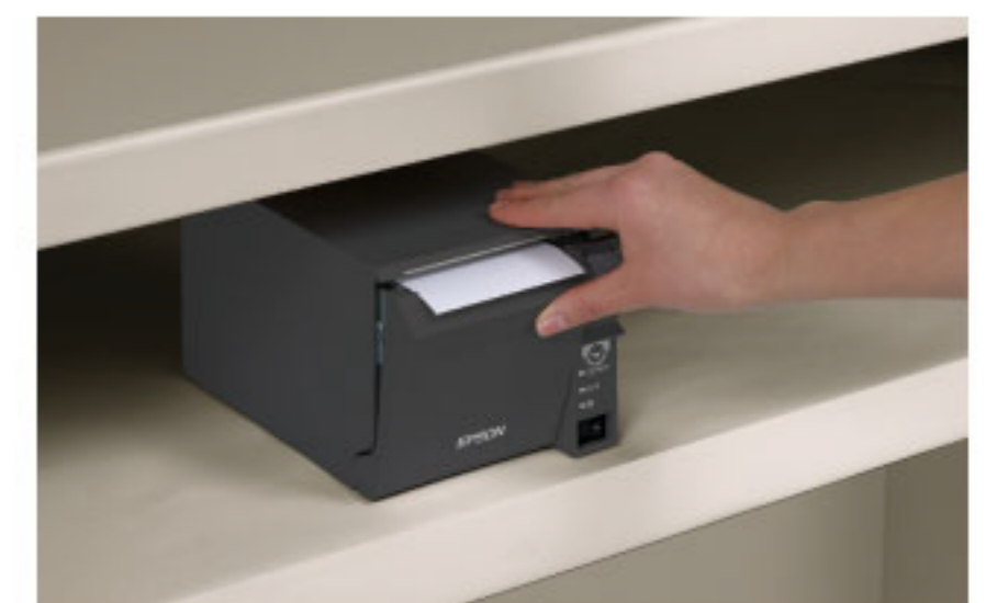
ชุดควบคุมสำหรับผู้ใช้งานที่ด้านหน้า

© 2013 Epson Singapore Pte Ltd สงวนลิขสิทธิ์ ห้ามทำซ้ำ ในบางส่วนหรือทั้งหมด โดยไม่ได้รับความยินยอมเป็นลายลักษณ์อักษรจาก Epson