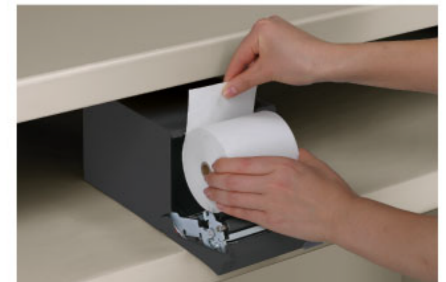
ชุดป้อนกระดาษด้านหน้าพร้อมที่ใส่ม้วนกระดาษ