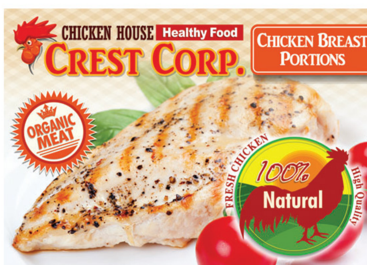
ฉลากอาหารและเครื่องดื่ม