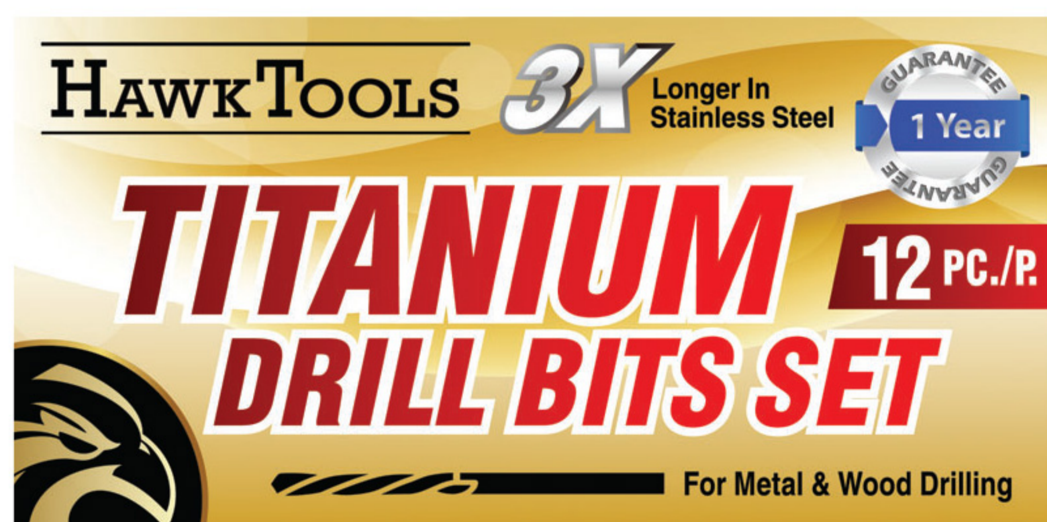
ฉลากอุตสาหกรรม

ค่า dpi ที่สูงกว่า ทำให้งานพิมพ์มีความคมชัด แม่นยำ และเก็บรายละเอียดได้มากขึ้น ให้ความละเอียดการพิมพ์สูงถึง 1200 dpi มาพร้อมเทคโนโลยีที่ปรับขนาดหยดหมึกได้ และจับคู่สีเฉพาะจุด* ทำให้งานพิมพ์คมชัด แม่นยำ เครื่องพิมพ์เอปสัน ColorWorks C6050A/P และ C6550A/P ให้งานพิมพ์สดใส สวยงาม และมีประสิทธิภาพ