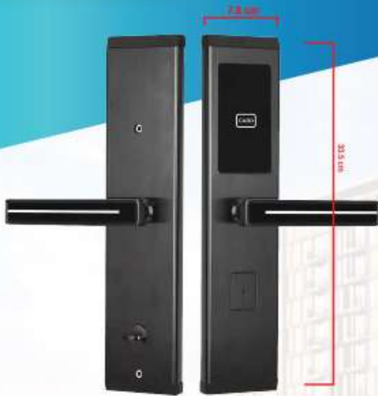
Internal ด้านในห้อง