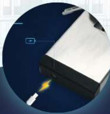
USB Charging Port