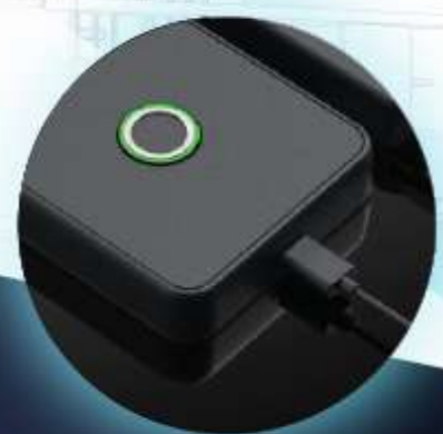
Emergency power supply