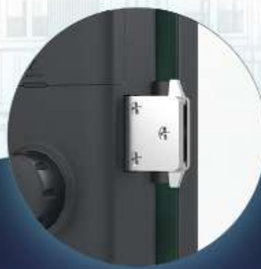
Top Security Lock Body