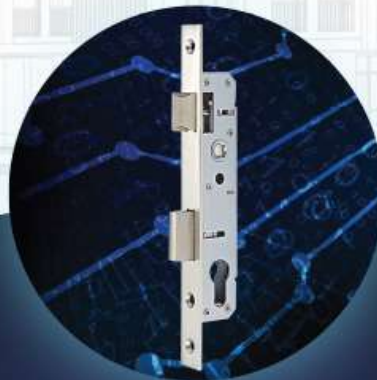
Top Security Lock Body