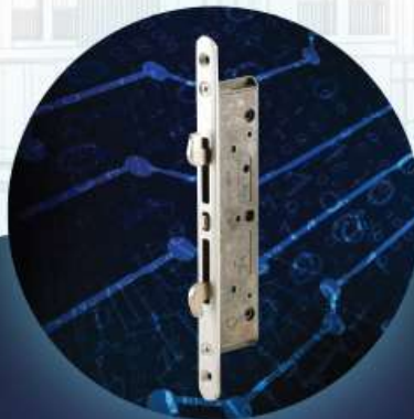
Top Security Lock Body