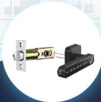
Top Security Lock Body