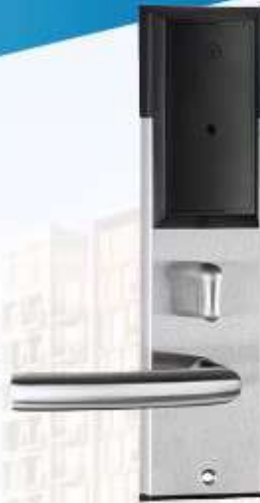
Internal ด้านในห้อง