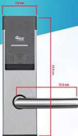
External ด้านนอกห้อง