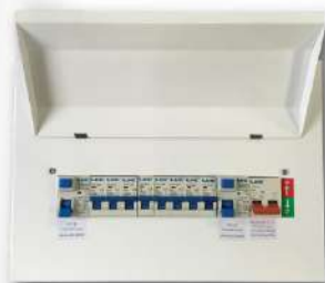
Consumer Unit Main 220V 50Hz.