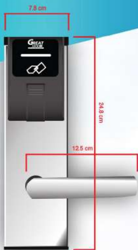
External ด้านนอกห้อง