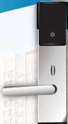
Internal ด้านในห้อง