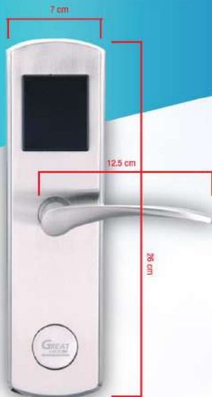
External ด้านนอกห้อง