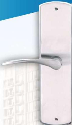
Internal ด้านในห้อง