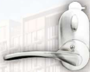
Internal ด้านในห้อง