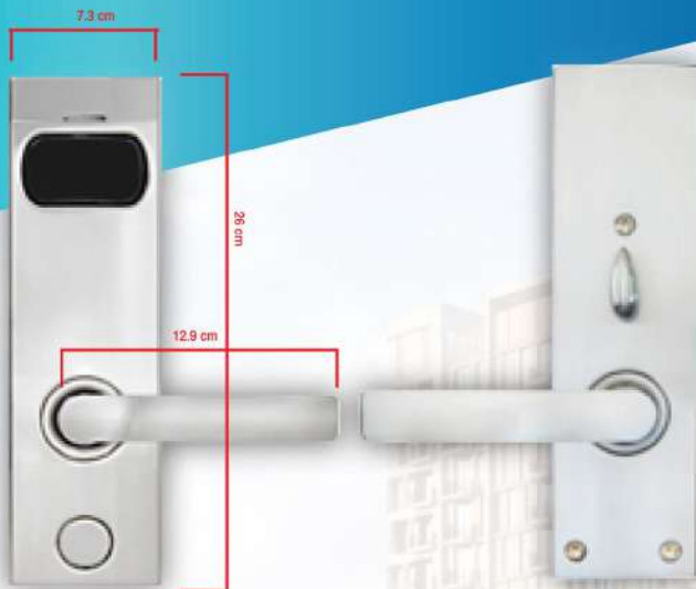
External ด้านนอกห้อง