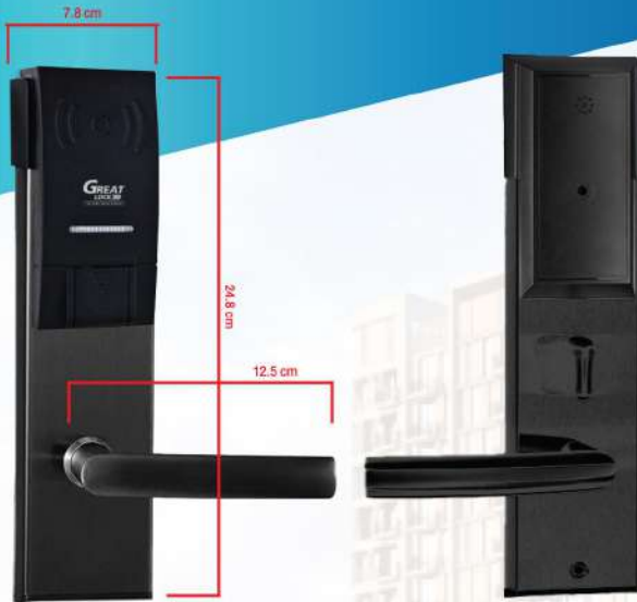
External ด้านนอกห้อง