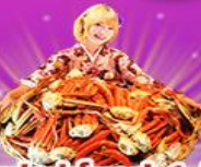
ราคา เริ่มต้น