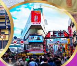
ตลาด อะเมโยโกะ