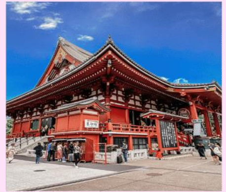
วัดอาซากุสะ SENSOJI TEMPEL | ASAKUSA TOKYO