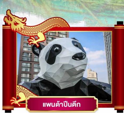
แพนด้าปิ่นตึก