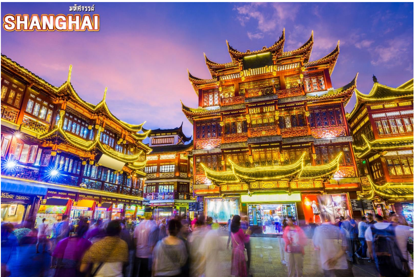
จากนั้น ชมบรรยากาศของ ตลาดร้อยปีเงินหวังเมี่ยว ตลาดที่เก่าแก่ของเมืองเซี่ยงไฮ้ อาคารบ้านเรือนบริเวณนี้ มีสไตล์สถาปัตยกรรมแบบจีนโบราณที่ยังคงความงดงามเอาไว้ ทั้งร้านขายอาหาร ร้าน