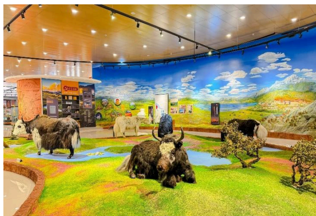
อย่าง จามรี เมือง ถิ่นที่ ชู่ถึง

มาทำความรู้จักกับจามรีให้มากขึ้นกับ พิพิธภัณฑ์จามรี พิพิธภัณฑ์ที่เล่าความเป็นมา ยาวนานเกี่ยวกับจามรี พร้อมโซนจัดแสดง รูปภาพและรูปปั้น โซนการแสดงการผลิตอาหารจากจามรี เพราะที่นี่ถือเป็นฐานโรงงานอุตสาหกรรมการผลิตอาหารแปรรูปจาก อีกด้วย นำท่านเดินทางสู่เมืองลี่เจียง เป็น ซึ่งตั้งอยู่ในหุบเขาที่มีทัศนียภาพงดงาม เป็น อยู่ของชาวหน่าซี แะร้านบัวหิมะหรือ ครีมเป่า หรือที่รู้จักกันในชื่อ "ครีมบัวหิมะ" สรรพคุณเป็นเลิศในด้านรักษาแผลไฟไหม้ฟุพอง รักษาอาการบวมแดงบน ผิวหนัง หรืออาการคันตามผิวหนัง แมลงกัดต่อยเป็นยาสามัญประจำบ้าน เดินเล่นปล่อยใจชิลๆ เมืองโบราณลี่เจียง (Lijiang Old Town) เมืองเก่ากว่า 800 ปี เป็นที่ตั้งรกรากของชาวหน่าซี หรือนาซี มีทางเดินที่ปูด้วยหินอัดแน่น อาคารไม้แบบจีนโบราณ ลำธารที่ไหลผ่านเกือบทุกหลังคาเรือน สะพานโค้งหินเก่าแก่ ได้รับการขนานนามว่า "เวนิสแห่งตะวันออก" และเป็นเมืองมรดกโลกอีกด้วย