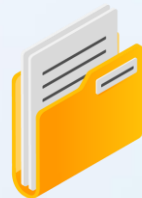
หนังสือรับรองนิติบุคคล