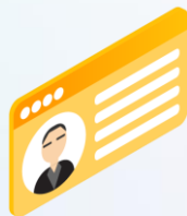
บัตรประจำตัวประชาชน